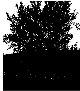
Duftiker við tré. Úr kynningarmyndbandi

Tré lífsins er frumkvöðlaverkefni í þróun og skiptist í þrjá hluta. Fyrsti hlutinn er skráning hinstu óska í persónulegan gagnagrunn, annar hlutinn er rafræn minningasíða og þriðji hlutinn bálstofa og Minningagarðar. Sá hluti sem snýr að handhöfum skipulagsvaldsins eru Minningagarðar. Í Minningagarðana verður aska látinna einstaklinga gróðursett ásamt tré sem mun vaxa upp til minningar um hinn látna og vera merkt rafrænu minningasíðu þess sem undir því hvílir.